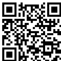
Рис.1 Официальный сайт Мультимедийного исторического парка «Россия-моя история»