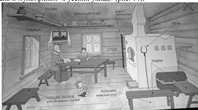
рис. 13 Кадр из мультфильма

– информационные ресурсы исторического парка «Россия - Моя история» – интерактивная панель и мультфильм «Русский уклад» (рис. 14).