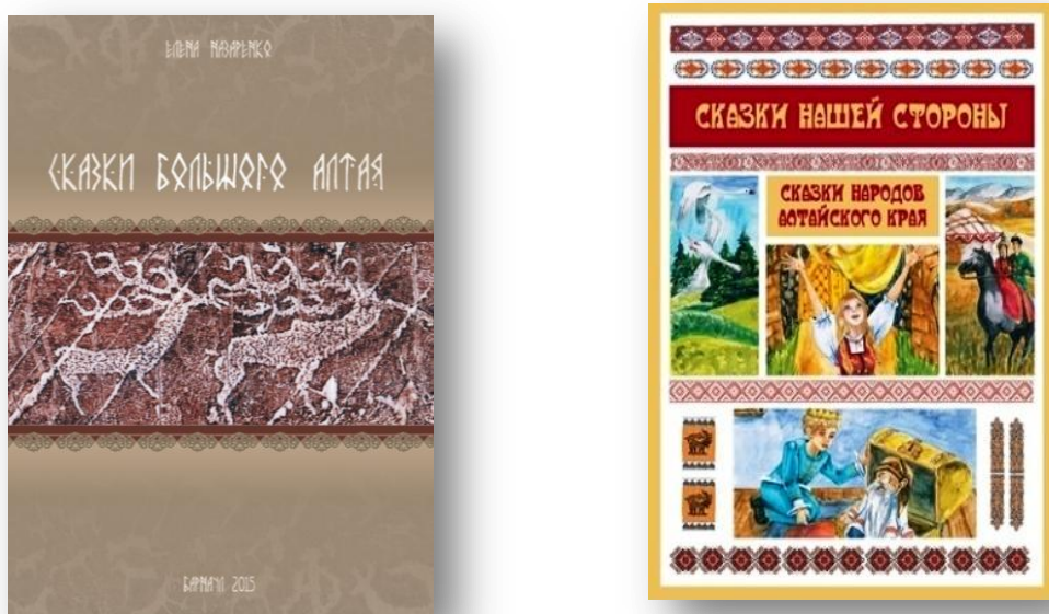
Рис. 1. Примеры региональных сказок

Это сложно, но есть прекрасный инструмент, который помогает, – мостик между педагогами и детьми – это сказка и, в том числе, сказка с точки зрения региональной принадлежности, сказки разных народностей. Этот инструмент можно назвать адаптированным вариантом рупора мифологической парадигмы. Такой метаинструмент способен стать базовой основой любого содержания образовательной деятельности (рис. 1).