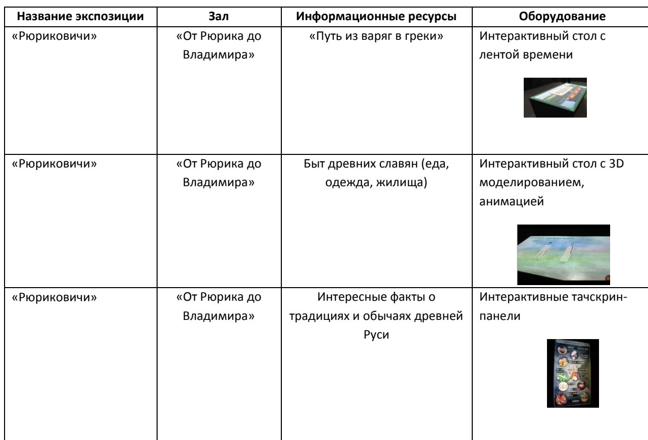
Таблица 1. Информационные ресурсы исторического парка «Россия – Моя история», рекомендованные для работы с детьми старшего дошкольного возраста при организации гражданско-патриотического воспитания

Практика реализации таких мероприятий в структуре реализации ФООП ДО оказывает влияние на системные изменения в образовательном пространстве детского сада, позволяет поучить эмоциональный отклик и развить интерес у детей, педагогов, родителей к истории родного Отечества, расширить представления взрослых и детей о ценностях народной культуры, как прочной опоры в воспитании и социализации этапа дошкольного детства.